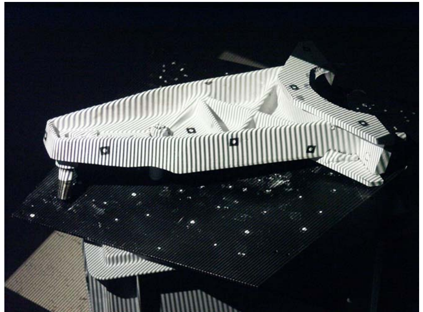
Numérisation optique d'un support